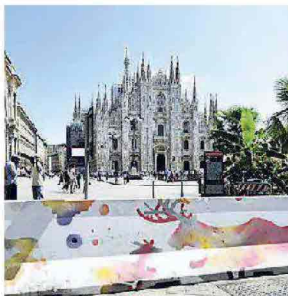
Milano, barriere al Duomo

riere, sulla Darsena e i Navigli e a corso Como, vicino alla torre Unicredit. L'amministrazione comunale ha poi lanciato un appello ai writer milanesi per colorare le barriere di cemento per renderli meno antiestetici, anche se l'idea resta quella di sostituire i new jersey con dei dissuasori di altro tipo: ad esempio i piloni uniti da catene d'acciaio collocati sul lungomare di Nizza dopo l'attentato del luglio 2016, che sono in grado di frenare la corsa dei tir. E c'è anche chi, come l'architetto Stefano Boeri, propone